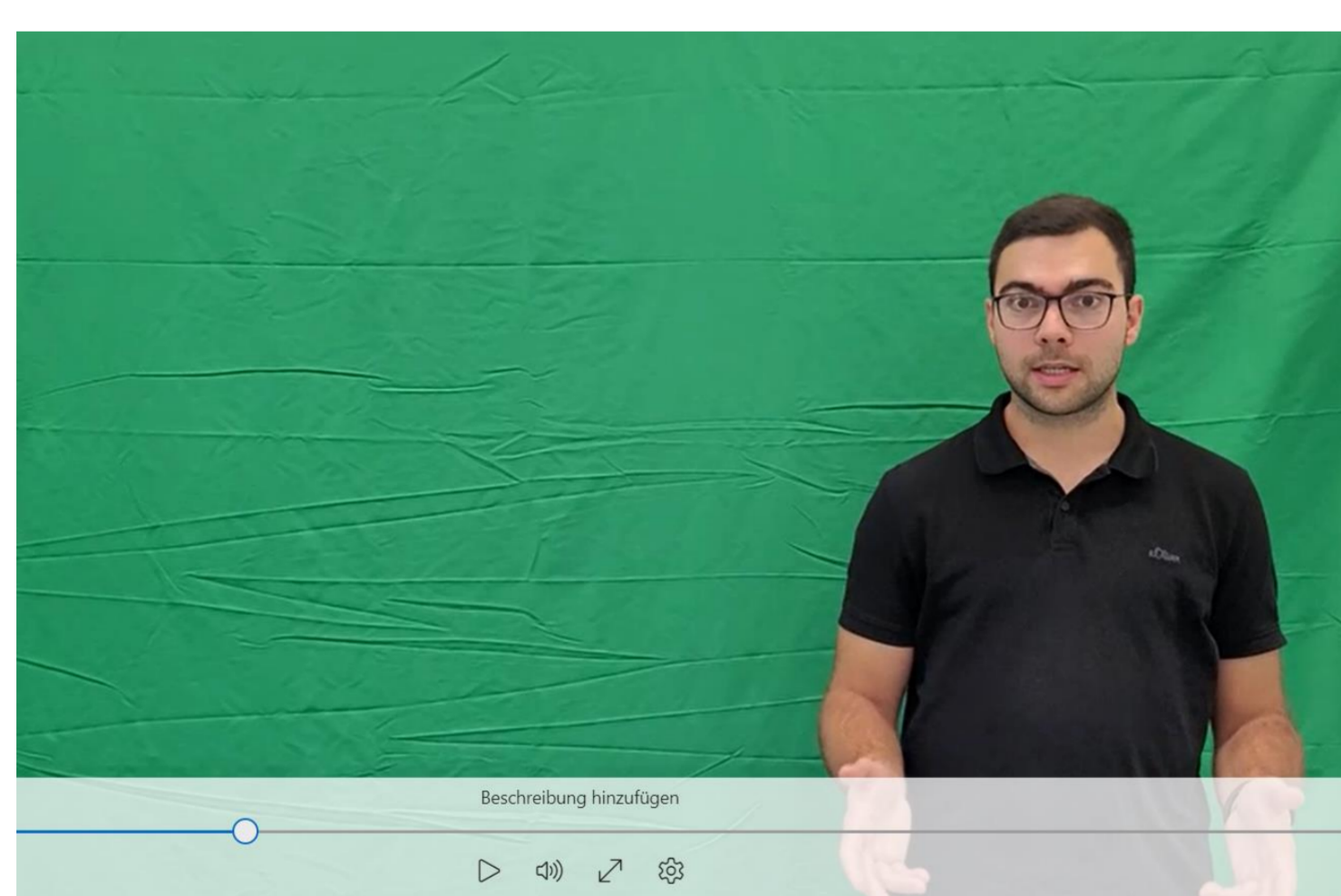
Erste eigene Versuche vor dem Greenscreen

Studierende erhalten die Möglichkeit, eigene Erklärvideos zu geschichtlichen Themen zu erstellen. Diese können sie als (Teil-)Prüfungsleistung im Seminar einbringen.